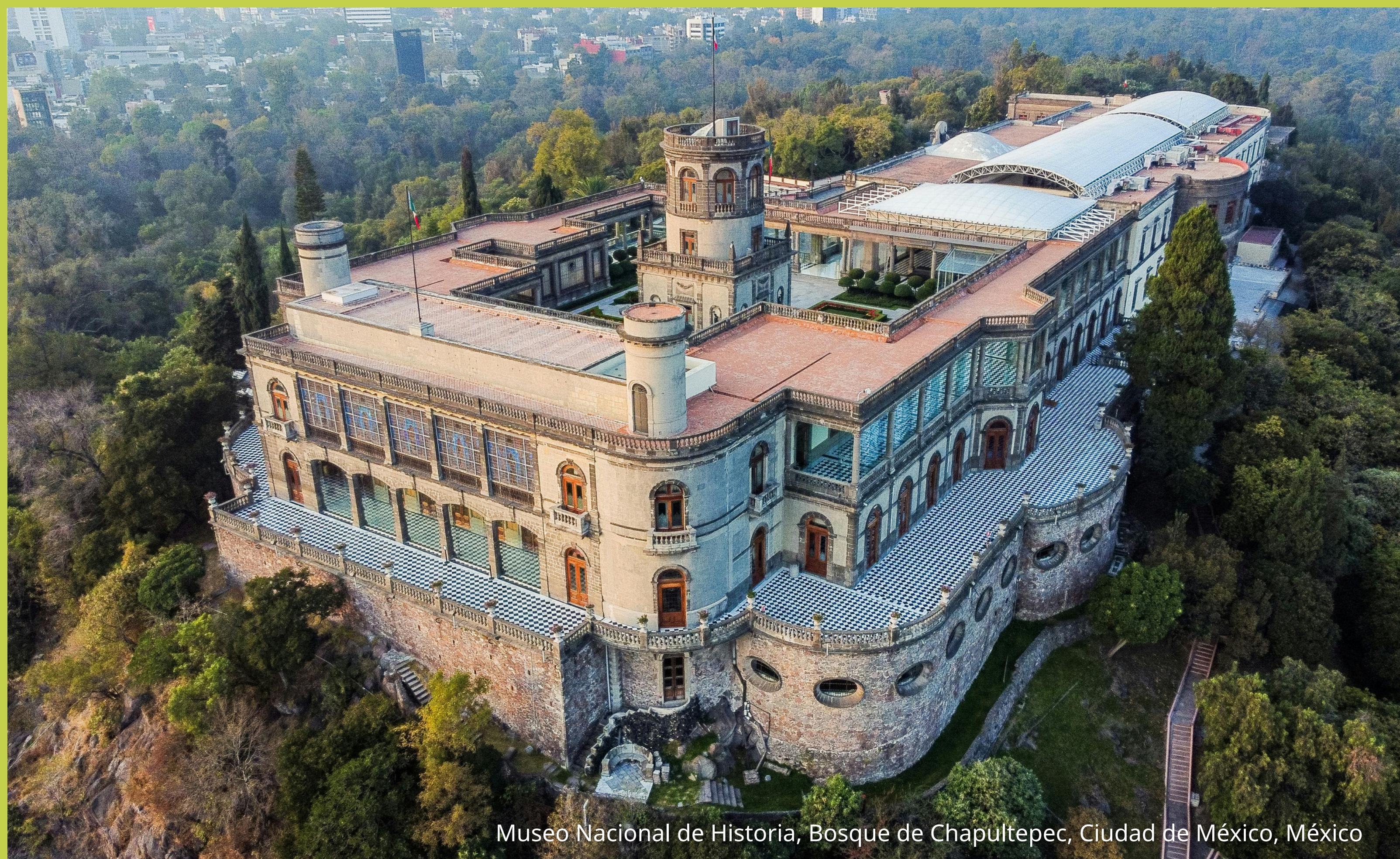
Museo Nacional de Historia, Bosque de Chapultepec, Ciudad de México, México