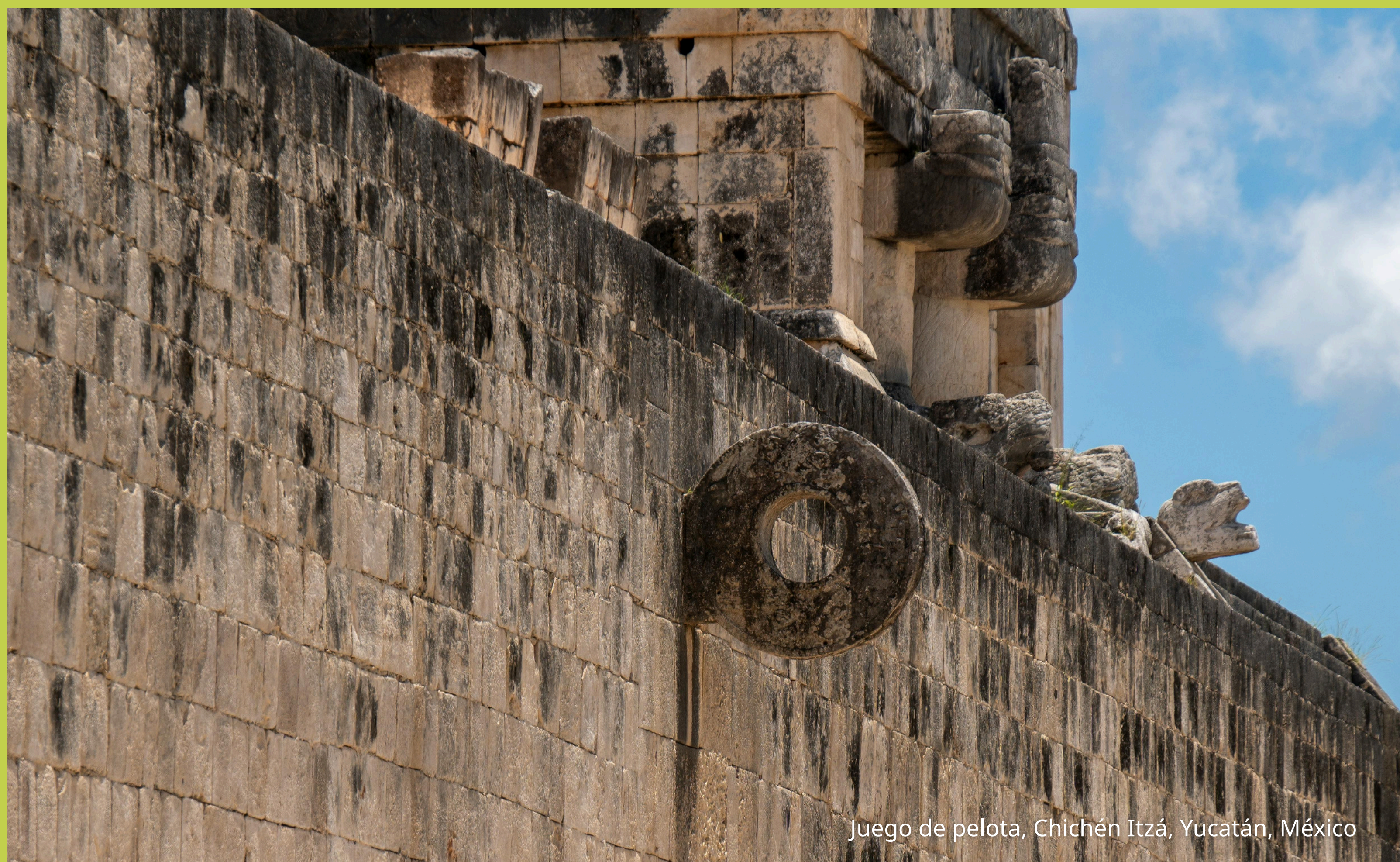
Juego de pelota, Chichén Itzá, Yucatán, México